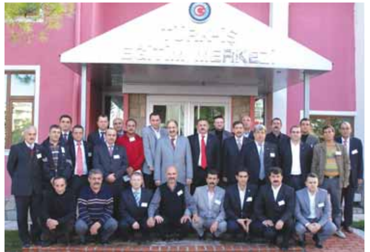
Teşkilatlanma Sekreterleri katılımcıları