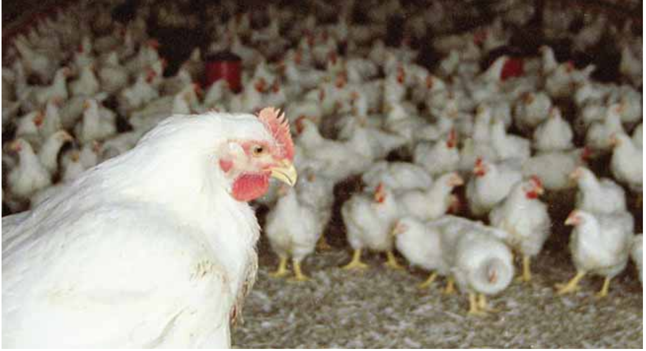
Tablo 4d. Türlerine Göre Kümes Hayvanları Sayısı 1991-2006 (Adet)