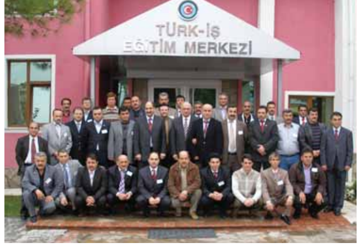
Mali Sekreterler katılımcıları

cilerimizin yüzde 27'si 1 yıl ve daha az süredir, yüzde 18'i 2,5-5 yıl arası, yüzde 23'ü 1,5-2 yıl arası ve yüzde 32'si 6 yıl ve daha fazla süre sendikal görev tecrübesine sahip bulunmaktadır.