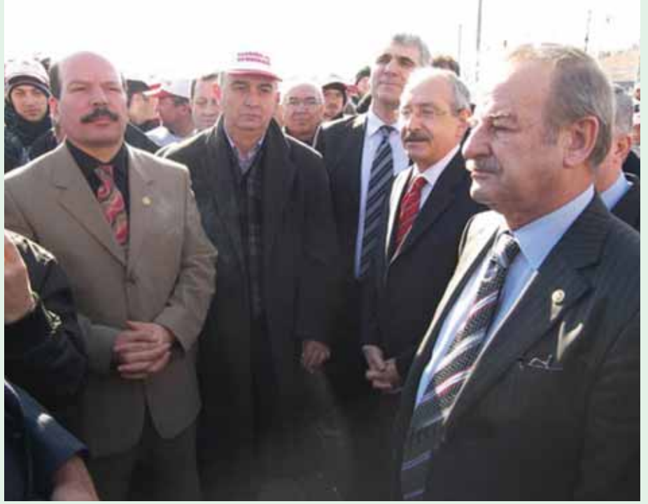
CHP Milletvekilleri Susurluk'ta Yörsan işçilerini ziyaret etti

İşçiler "Anayasaya göre herkes kanun önünde eşittir ve kamu gücünü, kamu adına kullanan Bakanlık yetkilileri, görevlerini, yansız, eşit ve kanuna uygun bir şekilde uygulamak zorundadır. Tespit edilen ve gerçekliği aşikar olan bir usulsüzlüğün sonuçlarını ortadan kaldırmak öncelikle