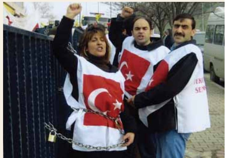
TEKEL Zincir Eylemi, İstanbul AKP İl Binası Önü, 09.01.2008 İstanbul TEKEL Cevizli Fabrikası işçileri kendilerini AKP İl Binası kapısına zincirledi.